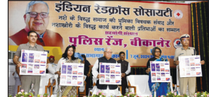
राज्यपाल के साथ अन्य अधिकारियों का समूह

युवाओं में नये की बढ़ती प्रवृत्ति चिंताजनक नशामुक्त समाज के लिए व्यापक स्तर पर हो पहल : राज्यपाल राज्यपाल ने कहा है कि नशे की बढ़ती प्रवृत्ति चिंताजनक है। उन्होंने कहा कि नशे की बढ़ती प्रवृत्ति चिंताजनक है। उन्होंने कहा कि नशे की बढ़ती प्रवृत्ति चिंताजनक है।